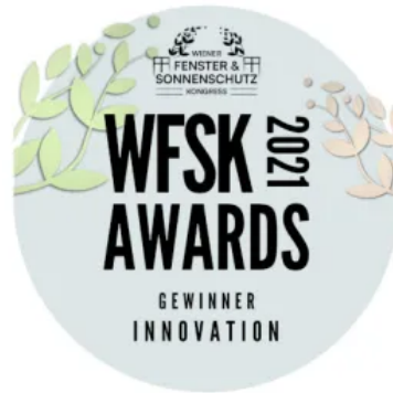
WFSK AWARDS 2021 1. Preis in der Kategorie Innovation. Ausgelobt von Interconnection Consulting im Rahmen des Wiener Fensterkongresses.