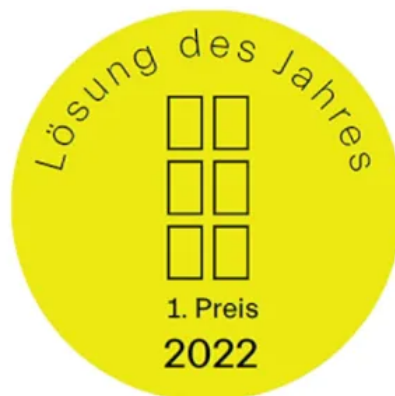
Award Wohnbauten des Jahres 2022 vom Callwey Verlag WINDOWMENT® gewinnt 1. Preis: Lösung des Jahres