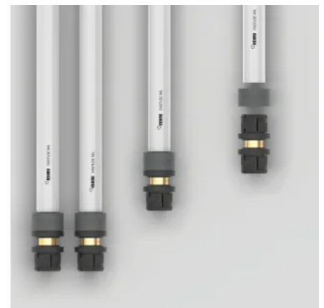
FASTLOC ML Rohre