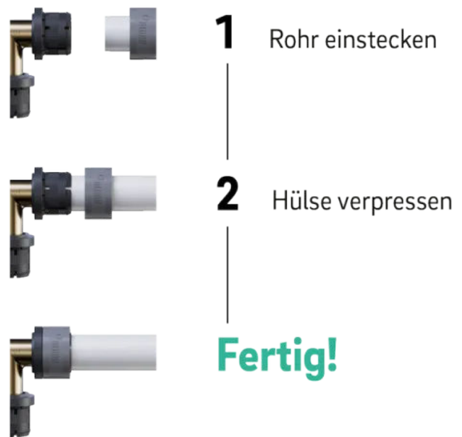
Nur zwei Arbeitsschritte zur dauerhaft sicheren Rohrverbindung.

Beim Verpressen drückt die Schiebehülse das Rohr über die Innenhülse gegen den Fitting-Grundkörper und das Rohrmaterial nimmt die Form der Fittingkontur an. Somit ist die Verbindung ohne zusätzlichen O-Ring dicht. Ein Kontrollfenster am FASTLOC Fitting zeigt an, ob das Rohr korrekt eingesteckt wurde. Alle unverpressten Verbindungen sind bei der Inbetriebnahme sofort erkennbar und können korrigiert werden.