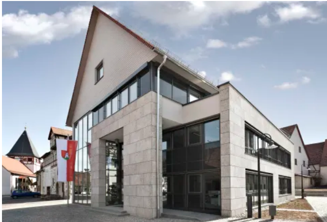
Rathaus Mönshheim, DE

Aus der Serie Vorgehängte hinterlüftete Fassadensysteme von Sto