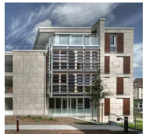
Stadtvillen "Wohnen am Botanischen Garten", Braunschweig, DE; Bauherr: Wiederaufbau Immobilien GmbH, Braunschweig, DE; Kanada Bau GmbH & Co., Beteiligungs- und Immobilien KG, Braunschweig, DE; Planung: Wolfgang Koch, Braunschweig, DE; Sto-Kompetenzen: StoVentec Stone Massive; Foto: Martin Duckek, Ulm, DE