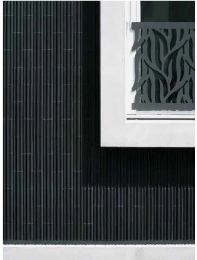
Materialübergang vom Sockel und Fenster zur Keramikfassade