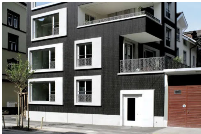
Stadthaus Zurlindenstrasse, Zürich, CH