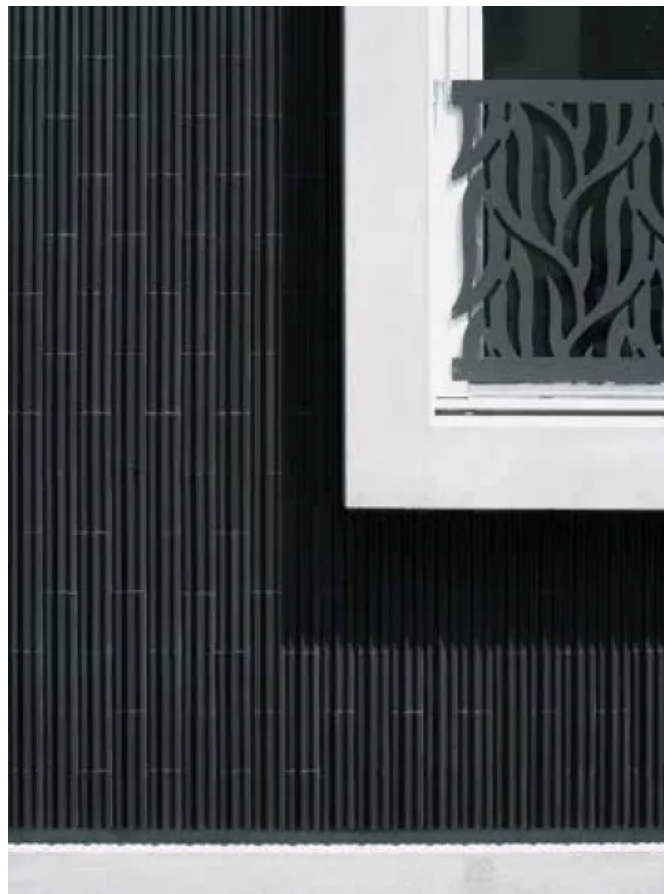
Materialübergang vom Sockel und Fenster zur Keramikfassade