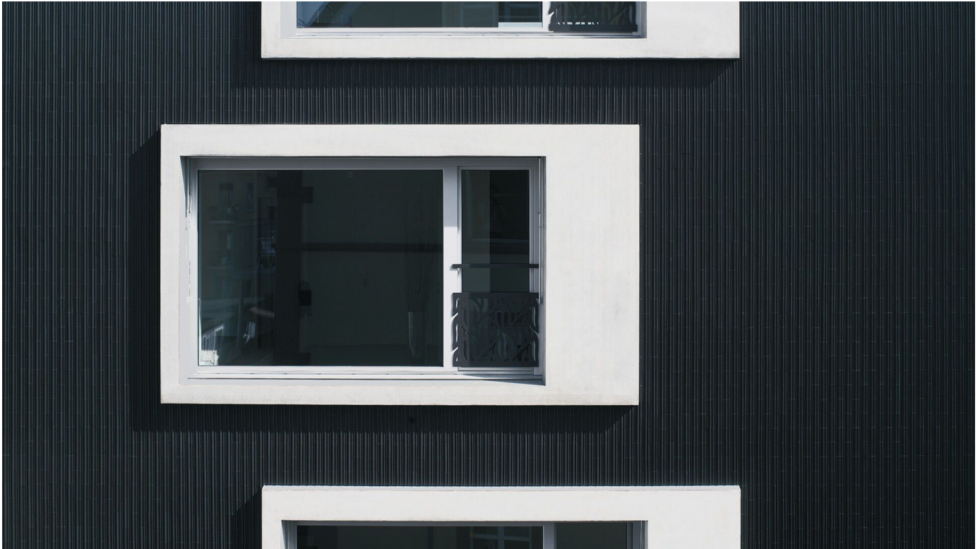
StoVentec C – Ausdrucksstarke Materialität von hinterlüfteten Fassaden mit Keramik

Aus der Serie Vorgehängte hinterlüftete Fassadensysteme von Sto