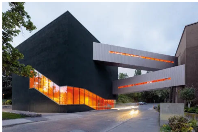
Elbarkaden in der HafenCity, Hamburg, DE