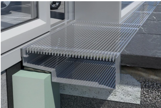
Kastenrinnen mit seitlicher Auskrägung Typ ino 611 KR

Für Eingangsbereiche zur Überbrückung der Perimeterdämmung eignet sich die Kastenrinne mit seitlicher Auskrägung Typ ino 611 KR in Kombination mit Typ ino 610 KR.