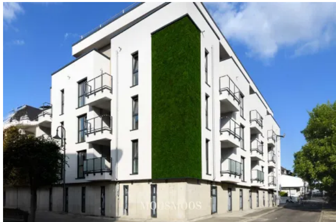
Echtes Moos an Gebäude - Fassadenbegrünungen

Aus der Serie Biophilic Interieur & Exterieur Design von MOOSMOOS