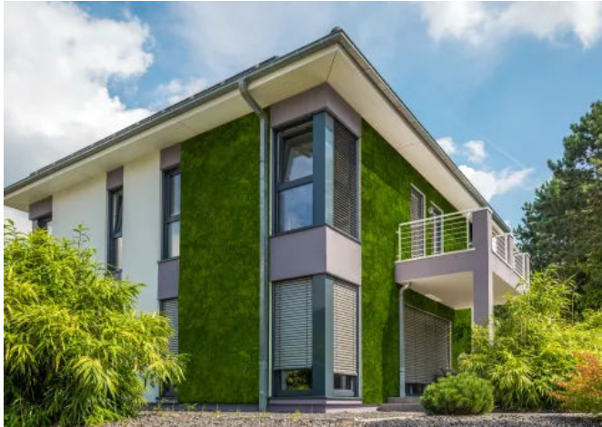
Moosfassaden - Fassadenbegrünungen