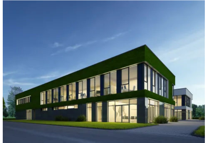
Moosfassaden - Fassadenbegrünungen