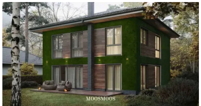
MOOSMOOS Greenovation, Haus im Wald - Fassadenbegrünungen

MoosMoos schafft grüne Lebensräume, die sowohl der Umwelt als auch den Menschen nachhaltig zugutekommen.