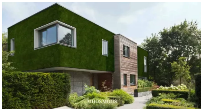
MOOSMOOS Greenovation, Einfamilienhaus - Fassadenbegrünungen