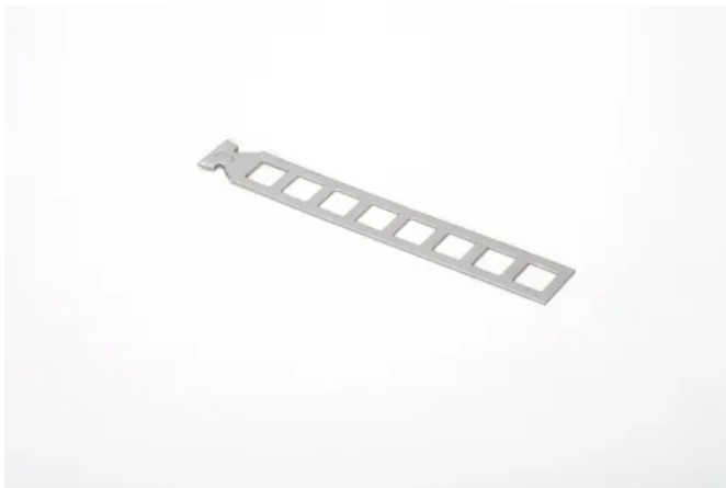
Maueranschlussanker JMA

Maueranschlussanker, in Kombination mit den entsprechenden Schienen oder Windposts, gewährleisten eine dauerhafte und sichere Verbindung von Mauerwerk zu angrenzenden Stahlbetonbauteilen. Diese Anker werden in den empfohlenen Abständen in den Fugenmörtel des Mauerwerks eingedrückt. Die Maueranschlussanker der Serie JMA sind sowohl für breite Fugen in der Dickbettvariante als auch für dünne Fugen in der Dünnbettvariante verfügbar. Diese sind in den Serien 12 und 18 erhältlich, um verschiedene Profile abzudecken. Zur Verbindung von Klinkermauerwerk eignen sich die gerade Form, die T-Form sowie die L-Form. Für großformatigen Porenbeton wird die Dünnbettvariante des JMA-D in der Klebefuge empfohlen.