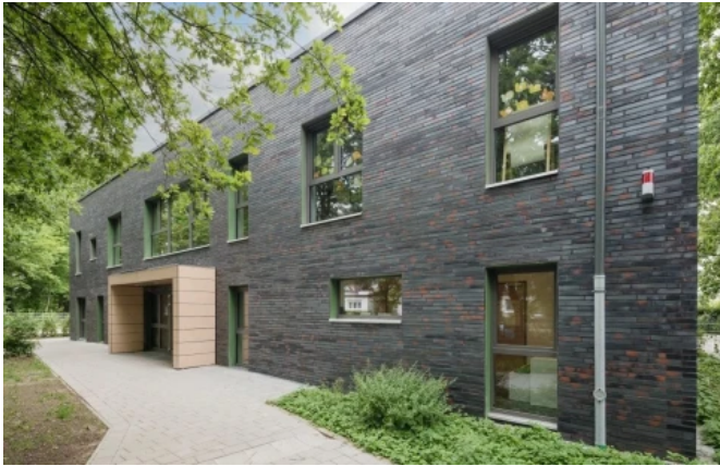
KiTa, Hamburg, Riemchen im King Size-Format: „Castle Rock“