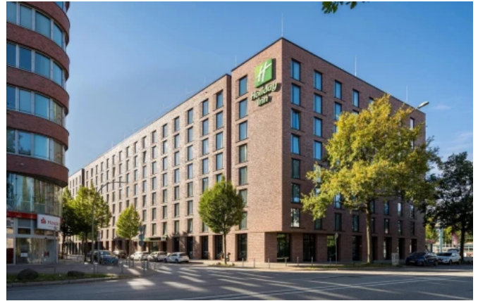
Hotelkomplex, Hamburg, „Old Residence“