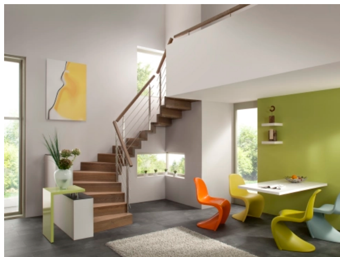
LINEA 652c, Faltrwerktrepp mit Relinggeländer