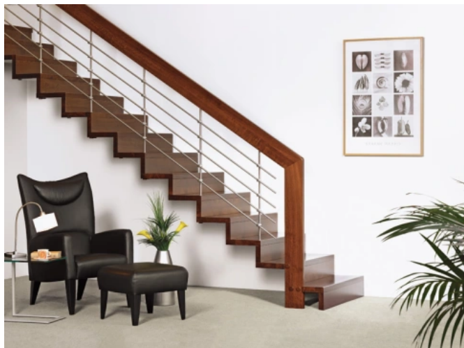
LINEA 588, mit Relinggeländer

Aus der Serie Vielseitige Treppenmodelle von Treppenmeister