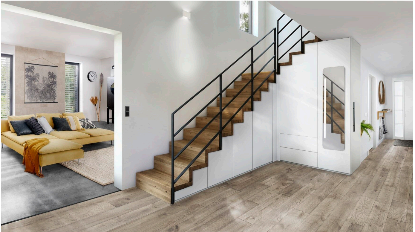
Faltwerktreppensystem in verschiedenen Materialkombinationen

Aus der Serie Vielseitige Treppenmodelle von Treppenmeister