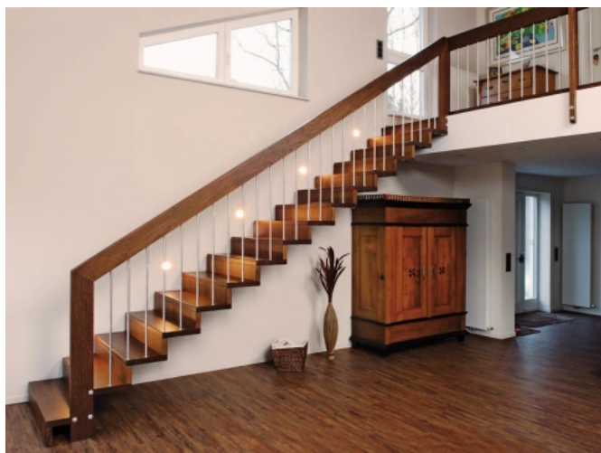
LINEA 593b, mit runden Edelstahlstäben