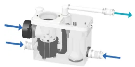
Sanipack Pro UP