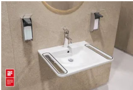
F4LT-Med Thermostat-Einhebelmischer eignen sich besonders für barrierefreie Waschplätze.