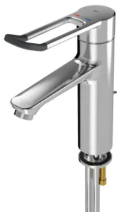
F4LT-Med Thermostat-Einhebel-Standbatterie mit Zugstange

Aus der Serie Sanitärarmaturen für Wasch- und Duschanlagen von KWC Aquarotter