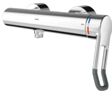
F4LT-Med Thermostat-Einhebel-Wandbatterie mit Handbrauseanschluss

Aus der Serie Sanitärarmaturen für Wasch- und Duschanlagen von KWC Aquarotter