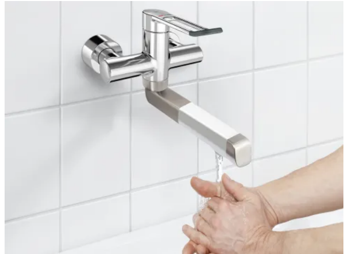
Die F4LT-Med Thermostat-Einhebel-Wandbatterie kann optional mit einem effektiv wirksamen Sterilfilter ausgestattet werden.

Mehr Informationen zum Einsatz des Sterilfilter mit KWC Professional Armaturen