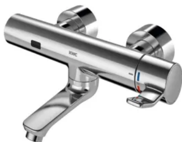
F4ET-Med Thermostat-Wandbatterie mit arretierbarem Auslauf