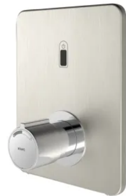
Elektronik-Thermostatbatterie F3E-Therm zur Wandeinbaumontage