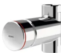
F3S Selbstschluss-Durchgangsventil zur Aufputzrohrmontage, zum Anschluss an vorgemischtes Warmwasser oder Kaltwasser