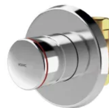
F3S Selbstschluss-Durchgangsventil zur Wandeinbaumontage, zum Anschluss an vorgemischtes Warmwasser oder Kaltwasser