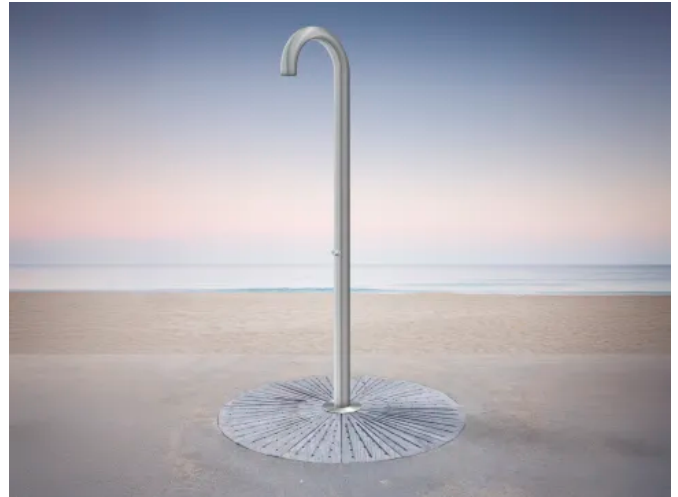
Standdusche mit F3S Durchgangsventil