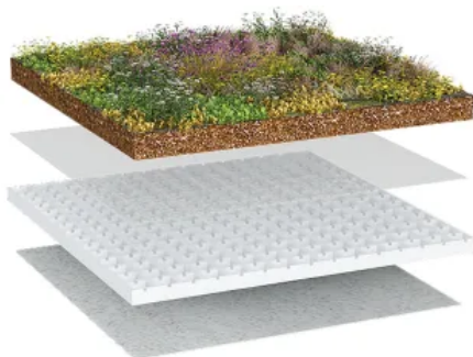
BauderGREEN Extensiv Sedumdach leicht, 0 - 5°