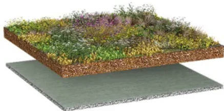
BauderGREEN Extensiv Sedumdach einfach, 1 - 5°