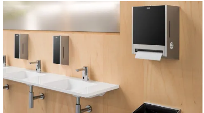
EXOS. Accessoires für die Aufputzmontage

Der Einsatz von austauschbaren Fronten in unterschiedlichen Materialausführungen wie Edelstahl und Glas, ermöglicht die Konzeption neuer Raumgefühle. Flexibilität findet man auch bei der Produktgruppe der Seifenspender. Hier lässt sich das Innenleben mühelos von elektronisch zu mechanisch, von Flüssigseife zu Schaumseife umrüsten. Dies ist bei Bedarf jederzeit möglich, auch im Nachhinein.