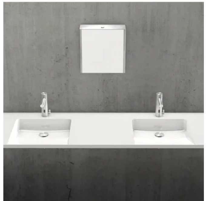
EXOS. Reihenwaschtisch aus Mineralgranit

EXOS. Waschtische lassen sich perfekt mit Waschtischarmaturen und weiteren Accessoires von KWC Professional kombinieren.