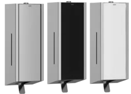
Edel, hochwertig, robust, modern, pflegeleicht und hygienisch. Drei verschiedene Oberflächen können gewählt werden: Edelstahl, MIRANIT oder Sicherheitsglas (ESG).

Einscheibensicherheitsglas ist ein Material, welches wie Edelstahl durch seinen zeitlosen Charakter und seine Kombinationsmöglichkeit mit anderen Materialien besticht. Glas und Edelstahl, stehen für Hochwertigkeit und zeitlose Eleganz. Beide Materialien sind aus der zeitgemäßen Raumgestaltung nicht mehr wegzudenken. Deshalb ist die bewusste Kombination der beiden Materialien besonders reizvoll. KWC Professional verwendet ausschließlich ESG-Glas.