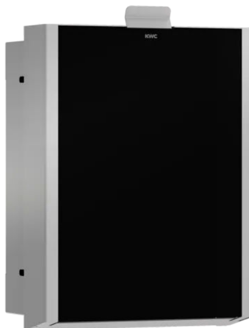
EXOS. Hygieneabfallbehälter, Unterputz, mit schwarzer Glasfront