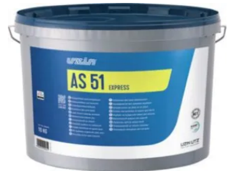
UZIN AS 51 EXPRESS zur Minderung des Wasserbedarfs von konventionellen Calciumsulfat- und Zementestrichen und Verkürzung der Wartezeit bis zur Belegreife