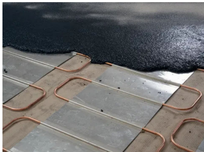
Gussasphaltestrich kann gemäß DIN 18560 als schwimmender Estrich, Industrieestrich und Heizestrich eingesetzt werden.