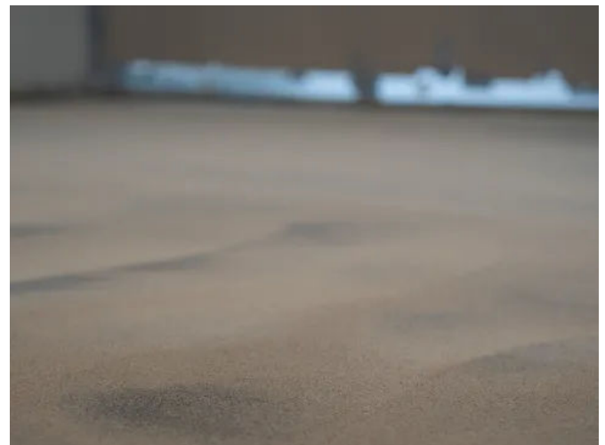
Gussasphaltestrich kann auf großen Flächen fugenlos eingebaut werden. Der Estrich ist widerstandsfähig, trittschalldämmend und schnell belegreif.

Die Herstellung von HOFMEISTER Gussasphaltestrich erfolgt in hochmodernen Asphaltmischanlagen. Die Verlegung erfolgt traditionell von Hand, bei großen Flächen auch maschinell.