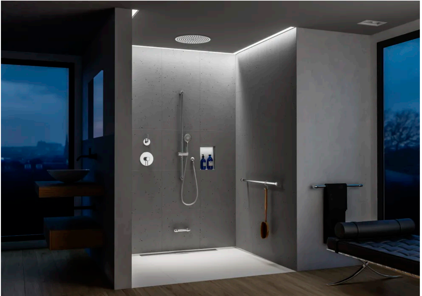
Duschnische VariGrip Brausestange

Aus der Serie Erlau Bauen im Bestand von Erlau