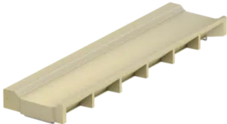
Muldenrinne mit Linierungskante

Aus der Serie Entwässerung von Sportstätten von ACO