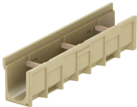
Kastenrinne mit Aufkantung