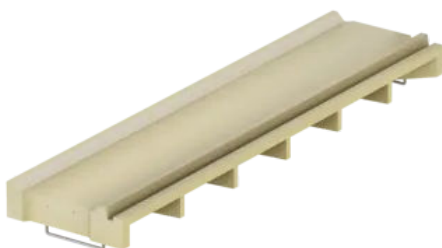
Muldenrinne mit Verkrallnut