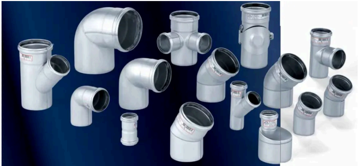
BLÜCHER® EuroPipe Abwasserrohrsystem

Aus der Serie Entwässerungssysteme von BLÜCHER Germany