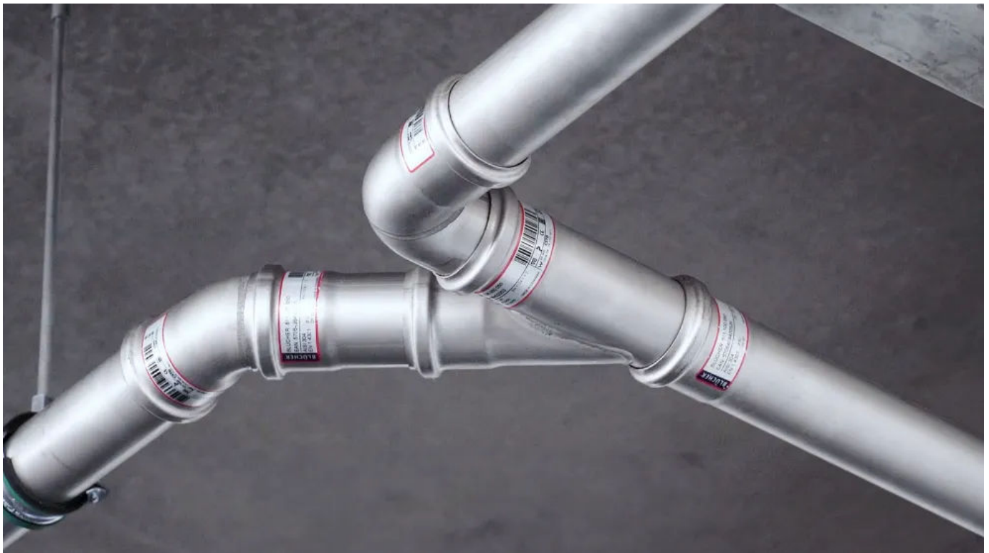
Installation über Steckverbindungen

Die Installation des BLÜCHER® EuroPipe Abwasserröhrsystems funktioniert über eine simple Steckverbindung (Push-Fit)