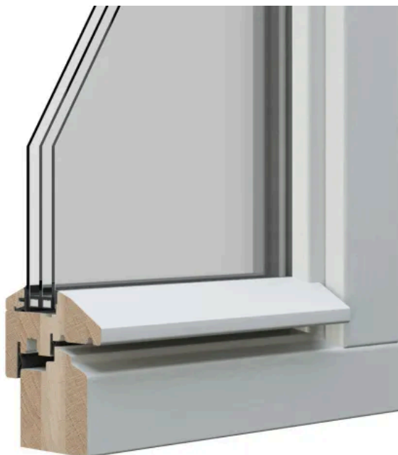
STIL 2 UPGRADE unprofilert | Beispiel: Eiche RAL deckend Diamond Finish

Aus der Serie Energetische Sanierung von Altbau bis Denkmalschutz von Döpfner