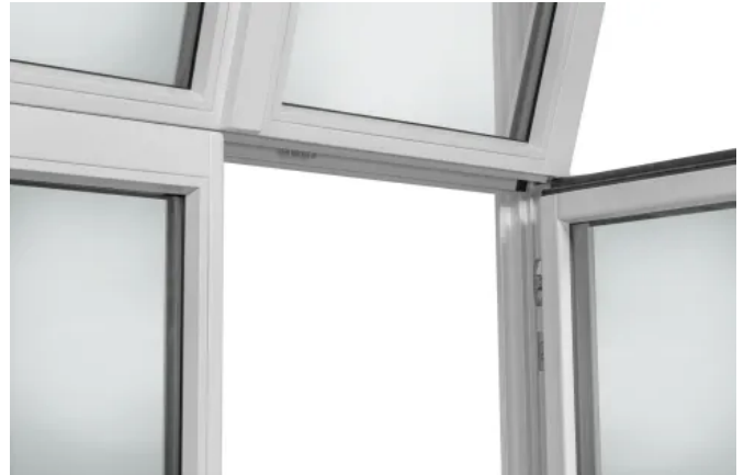
Konstruktion ohne Riegel

Wärmedämmung (gilt für STIL 2 und STIL 2 UPGRADE)