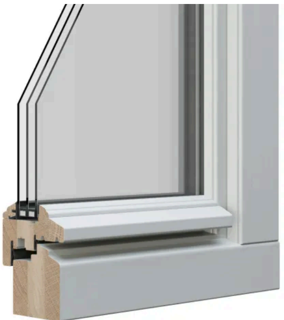
STIL 2 profilert | Beispiel: Eiche RAL deckend Diamond Finish