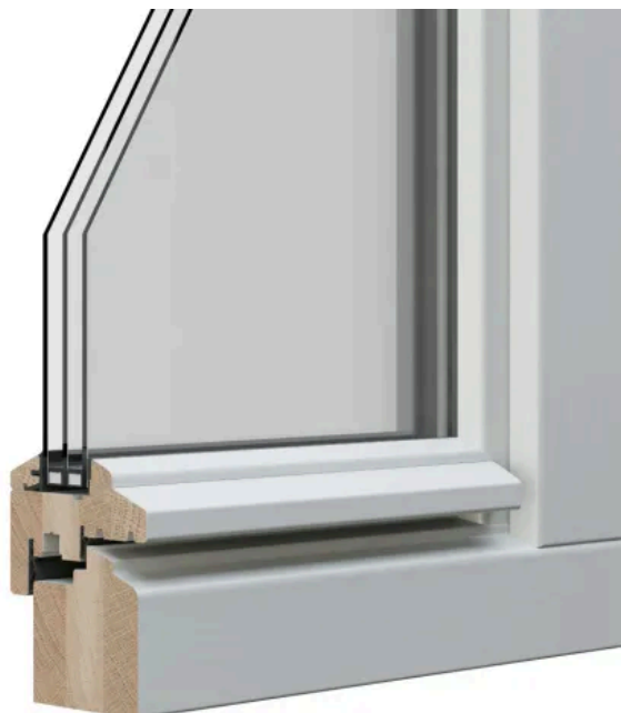
STIL 2 unprofilert | Beispiel: Eiche RAL deckend Diamond Finish