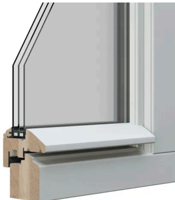
STIL 2 UPGRADE profilert | Beispiel: Eiche RAL deckend Diamond Finish