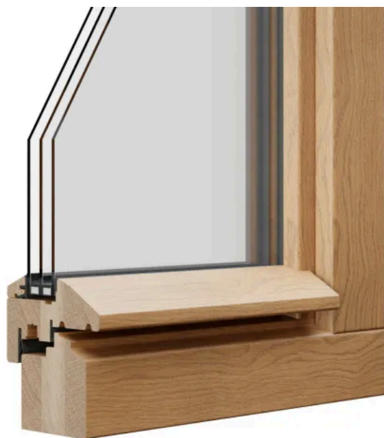
STIL 2 UPGRADE unprofilert | Beispiel: Eiche E0 lasierend Diamond Finish