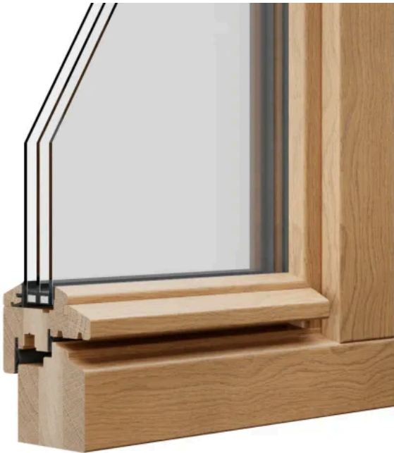
STIL 2 unprofilert | Beispiel: Eiche E0 lasierend Diamond Finish

Aus der Serie Energetische Sanierung von Altbau bis Denkmalschutz von Döpfner