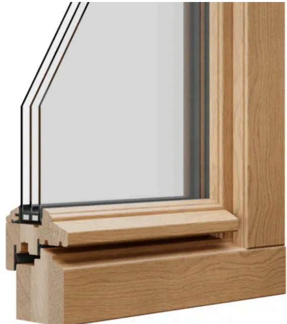
STIL 2 profilert | Beispiel: Eiche E0 lasierend Diamond Finish