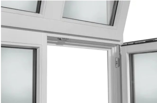
Konstruktion mit Riegel

Aus der Serie Energetische Sanierung von Altbau bis Denkmalschutz von Döpfner