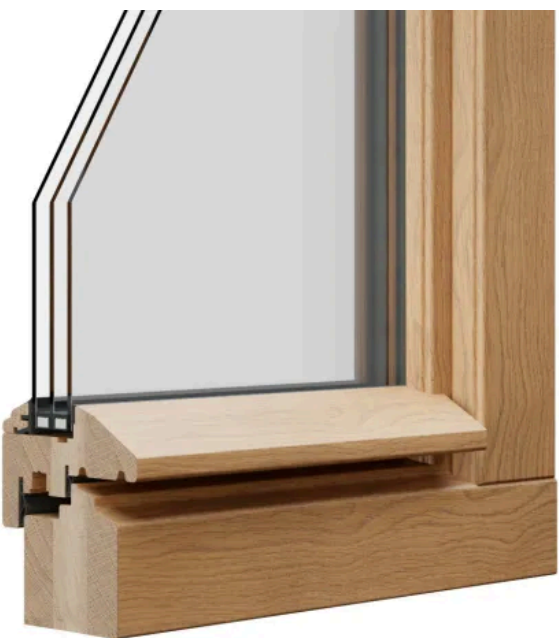
STIL 2 UPGRADE profilert | Beispiel: Eiche E0 lasierend Diamond Finish