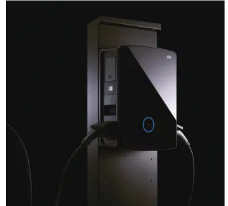
ABL Wallbox eM4 Twin