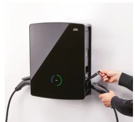
ABL Wallbox eM4 Twin