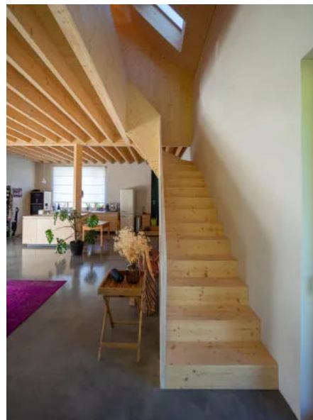
Auch für große Wandflächen mit hohen Decken ist der Lehmputz auf esb-Holzbauplatten geeignet.