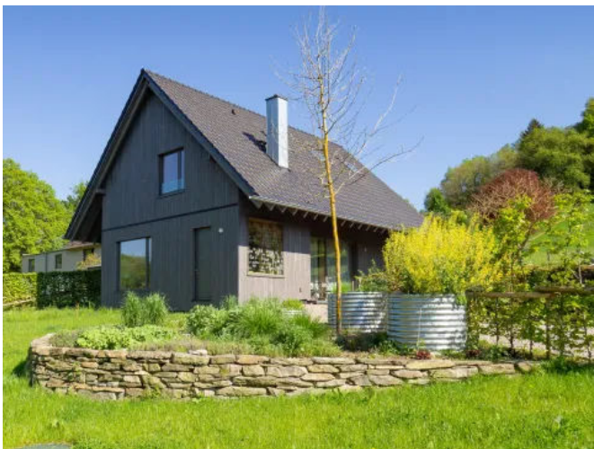
Einfamilienhaus in der Eifel, Holzständerbauweise mit esb-Plus Holzbauplatten und ClayTec Lehmputz im Innenbereich | Ausführung Zimmerei Krings Reinke, Monschau

Auf die unbehandelten esb-Plus Platten wird ein Schilfrohwergewebe in horizontaler Richtung befestigt, um die Stöße der Holzbauplatten zu überbrücken. Danach erfolgt der maschinelle Auftrag des ClayTec-Unterputzes. Die weitere Verarbeitung bis hin zum Finish erfolgt dann wie bei jeder konventionellen Wand.