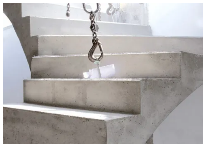
STEP – Element-Treppen, Betonfertigteiltreppe