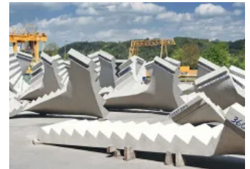
Sondertreppen - Betonfertigteiltreppe