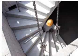
2x 1/4-gewendelt - Betonfertigteiltreppe