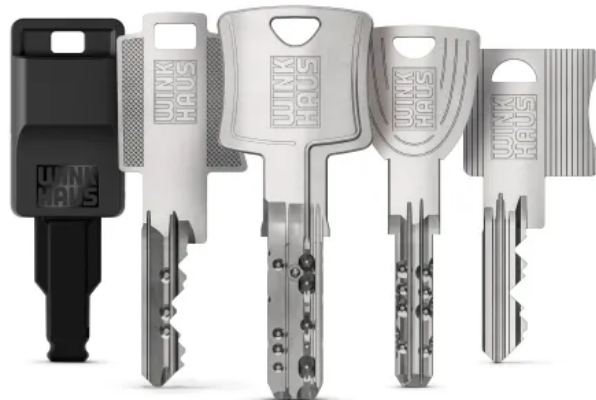
Moderne Schließsysteme von Winkhaus für Gebäude jeder Größenordnung.

Es sind die intelligenten Technologien und Dienstleistungen von Winkhaus, die das Leben leichter machen. Das Unternehmen bietet elektronische Zutrittslösungen und mechanische Schließsysteme. In beiden Produktbereichen setzt Winkhaus nicht nur auf die besondere Qualität und Langlebigkeit der Produkte sowie deren Benutzerfreundlichkeit, sondern entwickelt gemeinsam mit seinen hochqualifizierten Mitarbeitern ein individuell passendes Gesamtkonzept für das jeweilige Gebäude - egal ob Einfamilienhaus oder Unternehmen.