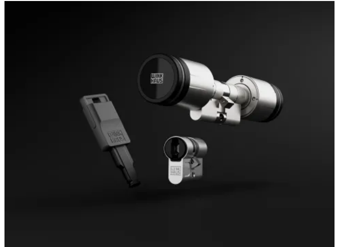
blueEvo bietet durch ihr umfangreiches Komponentenangebot Lösungen für nahezu jeden Einsatzbereich.

Alle Komponenten basieren auf der modernen Mifare DESFire EV3 Technologie, die einen sehr hohen Schutz gegen mechanische und elektronische Angriffe bietet. Digitale Schlüssel und andere sicherheitsrelevante Informationen werden in sogenannten Keystores gespeichert, um sie vor Hackerangriffen zu schützen. Bewegungsdaten, Personendaten und Änderungsprotokolle können automatisch gelöscht werden, um den Datenschutzrichtlinien zu entsprechen. Anonymisierte Türbuchungen können bei Bedarf über die Verwaltungssoftware zugeordnet werden. Optional kann ein 4- oder 6-Augen-Prinzip implementiert werden, um den Zugriff auf sensible Daten zusätzlich abzusichern.