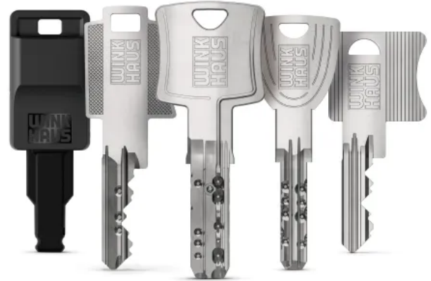
Moderne Schließsysteme von Winkhaus für Gebäude jeder Größenordnung.

Es sind die intelligenten Technologien und Dienstleistungen von Winkhaus, die das Leben leichter machen. Das Unternehmen bietet elektronische Zutrittslösungen und mechanische Schließsysteme. In beiden Produktbereichen setzt Winkhaus nicht nur auf die besondere Qualität und Langlebigkeit der Produkte sowie deren Benutzerfreundlichkeit, sondern entwickelt gemeinsam mit seinen hochqualifizierten Mitarbeitern ein individuell passendes Gesamtkonzept für das jeweilige Gebäude - egal ob Einfamilienhaus oder Unternehmen.