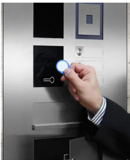
Zutrittskontrolle mit elektronischem Schlüssel

Ein spezieller, verschlüsselter Transponderchip in Form eines Schlüsselanhängers oder einer Schlüsselkarte wird einfach vor den Leser gehalten und öffnet so Türen, Briefkästen oder Schranken.