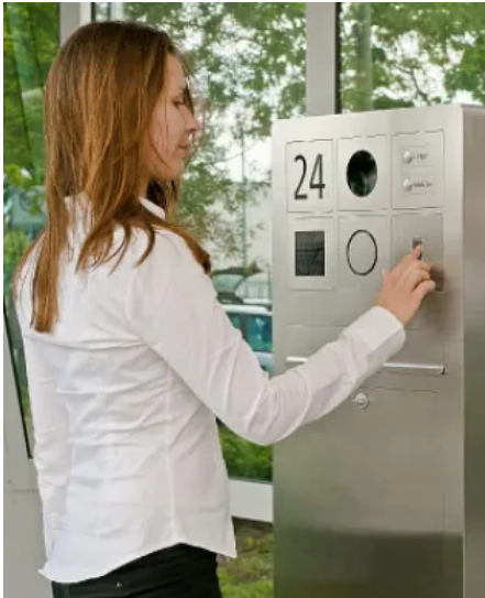
Elektronische Zutrittskontrolle mit Fingerscanner

Der Finger ist der Schlüssel, um Türen, Tore und Schranken aber auch Briefkästen zu öffnen. Das patentierte biometrische Verfahren des von Lippert eingesetzten Systems bietet ein Höchstmaß an Sicherheit, ist dabei aber kinderleicht zu bedienen.