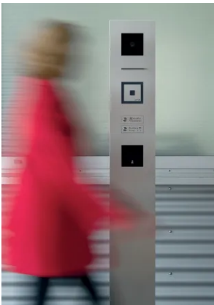
Zutrittskontrolle mit Radar-Bewegungsmelder

Der Radar-Bewegungsmelder löst automatisch Vorgänge aus, sobald eine definierte Bewegung erfasst wird, beispielsweise die Aktivierung von Beleuchtung.