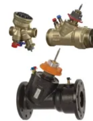
TA-MODULATOR: Druckunabhängiges Regel- und Regulierungsventil zur stetigen Regelung (PIBCV)

Druckunabhängiges Regel- und Regulierungsventil für eine präzise Temperaturregelung. Das Ventil kann sowohl mit stetigen als auch mit 3-Punkt Stellantrieben ausgerüstet werden. Der integrierte Differenzdruckregler garantiert eine hohe Regelautorität und Regelstabilität sowie eine automatische Begrenzung der Durchflussmenge. Die Messung des Durchflusses und des verfügbaren Druckes ermöglicht eine Systemoptimierung und Diagnose.