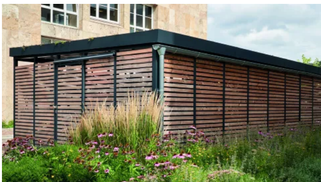
Einhausung in Füllungsvariante Lärchenholz mit Gründach

Ob als Teil moderner Außenanlagengestaltung im Mehrfamilienhaus, als Ausstattung für kommunale Einrichtungen wie Kitas und Schulen oder als witterungsgeschützter Mitarbeiterunterstand in Gewerbeobjekten: Die Einhausungssysteme von Gerhardt Braun bieten vielseitige Einsatzmöglichkeiten. Dank modularer Bauweise und individuell konfigurierbarem Baukastensystem passen sie sich Neubauten ebenso an wie bestehender Architektur.