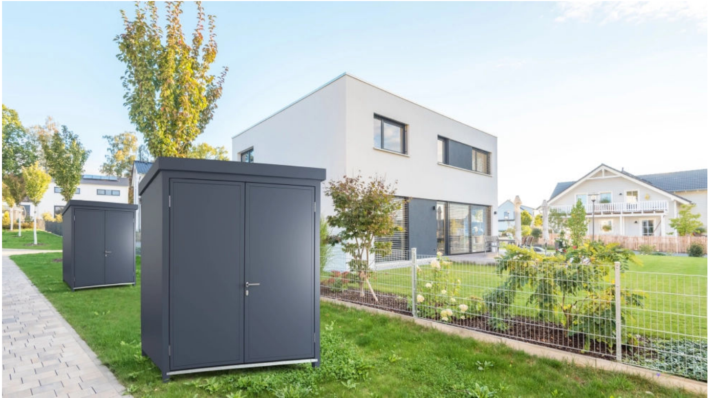
Gerätehäuser von Gerhardt Braun in Vollblech

Aus der Serie Einhausungen von Gerhardt Braun