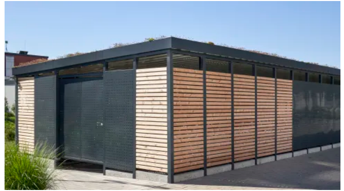
Einhausung im Materialmix Lärchenholz mit Quadratlochblech und Gründach