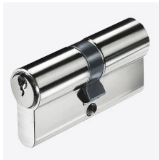
Profilzylinder für Gerätehäuser von Gerhardt Braun