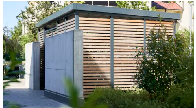
Einhausung in Füllungsvariante Lärchenholz