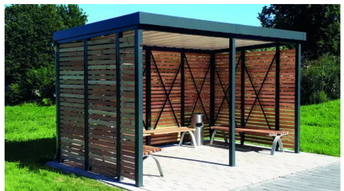
Einhausung in Füllungsvariante Lärchenholz, vorne geöffnet