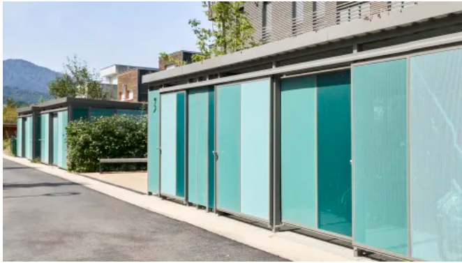
Einhausung in Füllungsvariante Lochblech in verschiedenen Farben

Aus der Serie Einhausungen von Gerhardt Braun