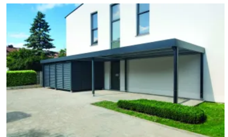
Vordach Serie CP mit Geräteraum als Kellerersatzraum