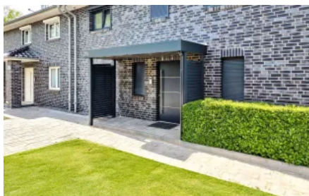
Vordach Serie CP mit Seitenwänden aus Stahlwelle