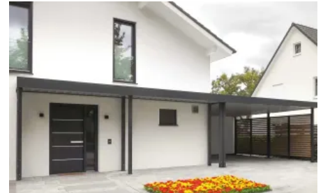
Vordach Serie CP mit Anbindung an den Carport mit Sichtschutzelement aus Holz