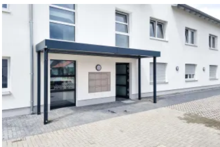
Vordach Serie CP