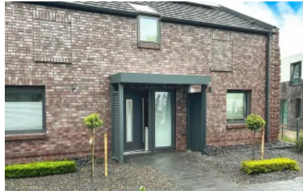
Vordach Serie CP mit Seitenwänden aus Stahlwelle