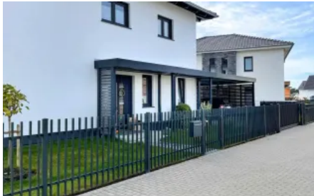
Vordach Serie CP mit Anbindung an den Carport

Aus der Serie Überdachungen von Siebau Raumsysteme