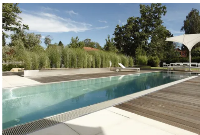
MONSUN GALA für ein individuelles Design in GaLa Konzepten

Besondere Effekte erzielt die Illumination der Elemente mittels einzelner Leuchten oder LED-Lichtbänder.