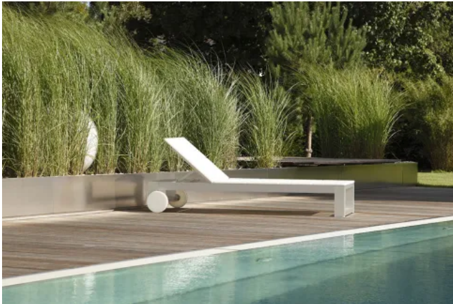
Gestaltungsfreiheit und Formenvielfalt mit MONSUN GALA Einfassungen aus Metall

Aus der Serie Entwässerungssysteme von MONSUN