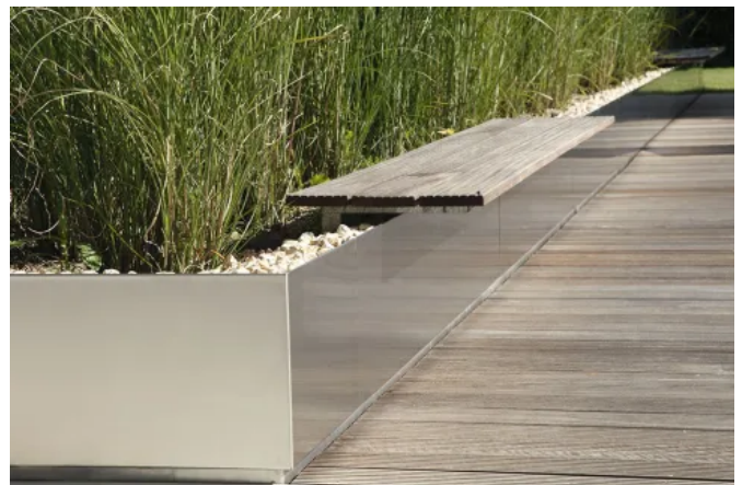
Abmessungen und Dimensionierung der GALA Metallelemente sind variabel.