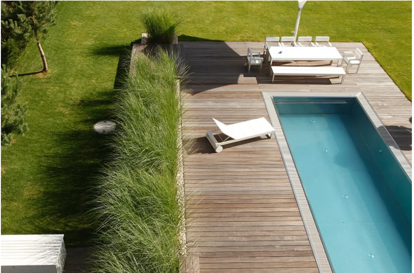
MONSUN GALA umfasst Einfassungen aus Edelstahl, Aluminium und COR-TEN Stahl

Aus der Serie Entwässerungssysteme von MONSUN