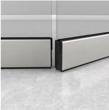
Türschiene TP/TA EASY Safe