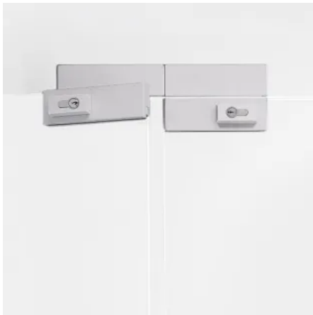
Mittel- und Eckschlösser SG