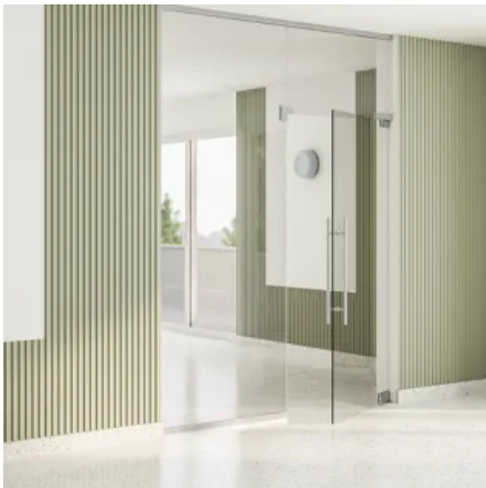
Eckbeschlag UNIVERSAL Motion NG33