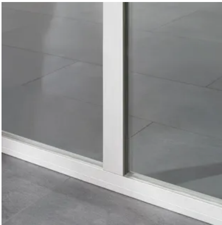
Profilsystem MR 22 / MR 28