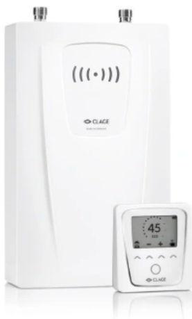
CFX-U (elektronisches Unterbaugerät)

Die Heizleistung der kompakten Durchlauferhitzer garantiert einen idealen Warmwasserkomfort für die Anwendung an der Küchenspüle. Sie reicht auch, wenn es darum geht, eine einzelne Dusche sparsam oder einen Waschtisch komfortabel zu versorgen. Somit ist die Klasse der Kompakt-Durchlauferhitzer vielseitig verwendbar. Sie sind beispielhaft für die bedarfsgerechte Einsatzmöglichkeit von Durchlauferhitzern.