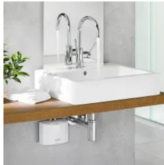
E-Klein-Durchlauferhitzer MCX6 am Aufsatz-Waschtisch „Vero“ von Duravit mit Armatur „Tara Logic“