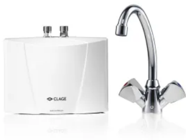
Set M 3 / SNM

Druckloser Klein-Durchlauferhitzer als Komplett-Set mit passender Spezial-Mischbatterie. Über dem Waschbecken installiert, spart das kleine Gerät kostbaren Bereitschaftsstrom. Zur wirtschaftlichen Warmwasserversorgung einer einzelnen Zapfstelle im Temperaturbereich von etwa 35 °C bis 50 °C.