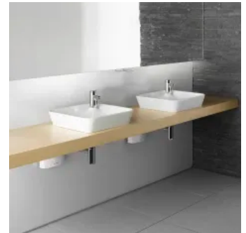
Zwei Komplett-Anlagen MBX Lumino (E-Klein-Durchlauferhitzer mit berührungsloser Leuchtarmlatur) am Doppelwaschtisch