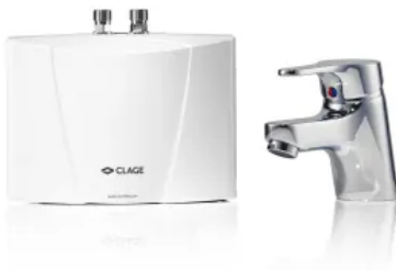
Klein-Durchlauferhitzer-Set M 3 / END