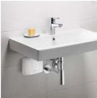
E-Klein-Durchlauferhitzer MCX7 am Keramag-Waschtisch Serie „Icon“