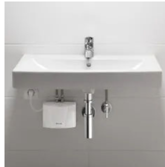
E-Klein-Durchlauferhitzer MCX3 am Keramag-Waschtisch Serie „Icon“, Steckeranschluss