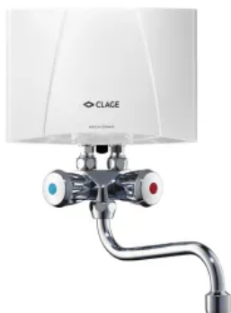
Set M 3 - 7 / SMB