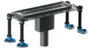
DallFlex 2.0 senkrecht

Mögliche Ablaufvarianten für CeraFrame Liquid Neo