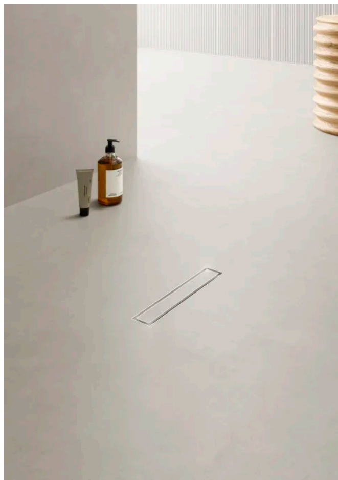
Fugenloser Duschboden mit CeraFrame Liquid Neo

Weiterführende Informationen zu Duschrinnen CeraFrame Liquid Neo