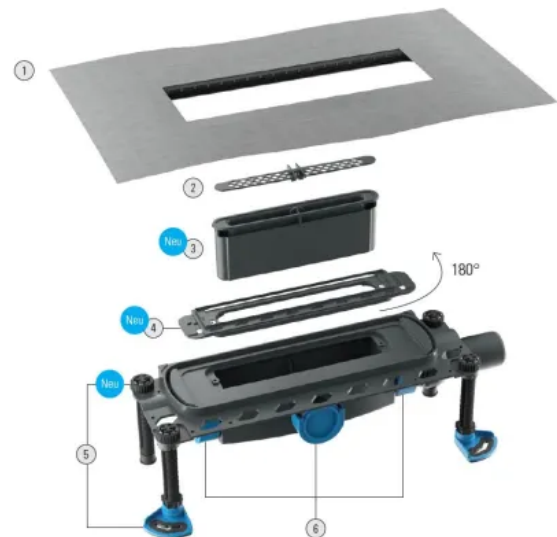
Ablaufgehäuse DallFlex 2.0 mit verbesserten Details