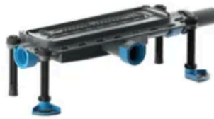
DallFlex 2.0 Plan