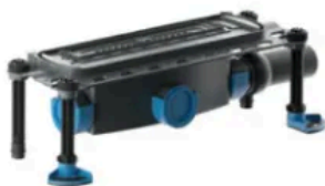
DallFlex 2.0 115