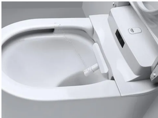
Das GROHE Sensia Arena bietet zahlreiche individuelle Einstellmöglichkeiten.

Das GROHE Sensia Arena bietet den Luxus einer vollen Kontrolle über alle Aspekte der Hygiene. Über die Fernbedienung oder direkt am Dusch-WC lässt sich die bevorzugte Einstellung wählen. In der GROHE Sensia Arena App kann ein persönliches Profil abgelegt werden. Dank der GROHE SkinClean Technologie können Art, Stärke und Position des Strahls durch den Nutzer ausgewählt werden.