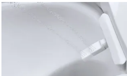
Oszillierender Strahl: Der Duscharm bewegt sich leicht vor und zurück und sorgt damit für einen größeren Reinigungsbereich und mehr Erfrischung.