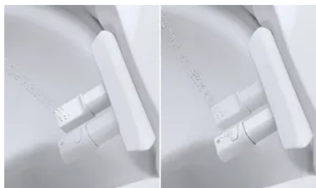
Zwillingsduscharm: Zwei separate Duscharm für Standard-Dusche und Lady-Dusche.