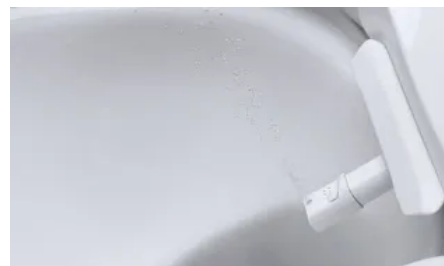
Massage-Strahl: Durch einen ständigen Wechsel zwischen sanftem und starkem Strahl wird eine entspannende Massage erzielt.