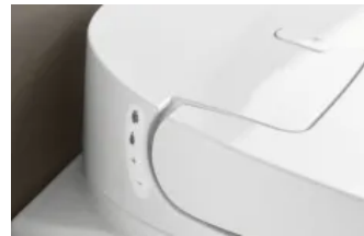
Steuerung am Sitz