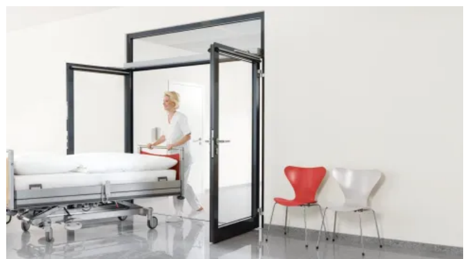
Drehflügeltürantrieb ED 100/ED 250 zweiflügelig