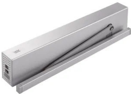
DORMA ED 100 / ED 250