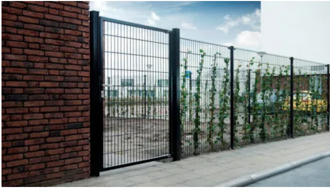
Drehflügeltor Proteus 2