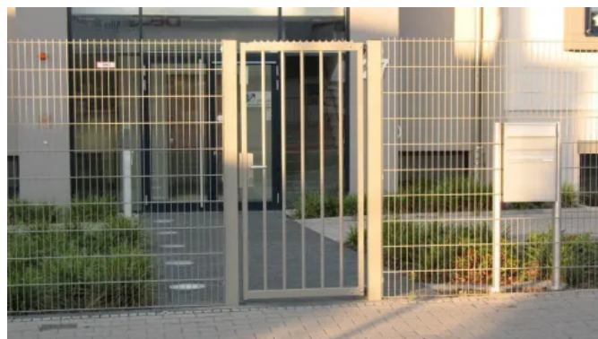
Drehflügel Tor Euro 2