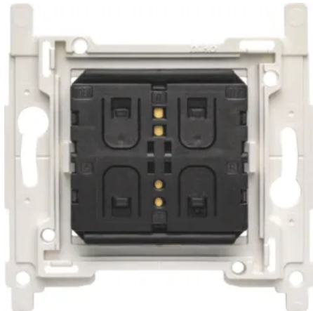
Niko Funk-Dimmerschalter, KNX®

Aus der Serie Schalter- und Steckdosensysteme für Innen- und Außenbereiche von Wygwan Deutschland