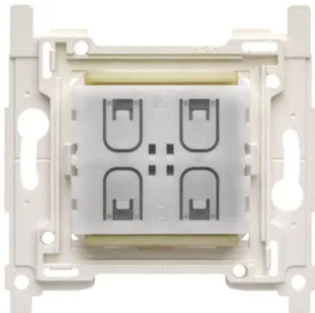
Niko Funk-Dimmerschalter, Bluetooth®

Weitere Informationen zum Niko Funk-Dimmerschalter, KNX®