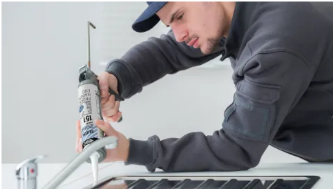
Anwendung EGOSILICON 151 SANITÄR