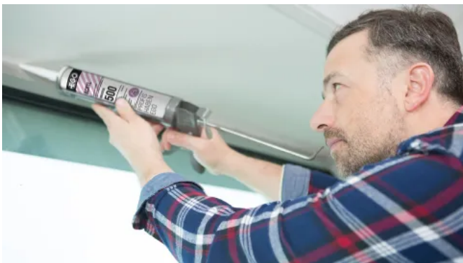
Anwendung EGOCRYL 500 MALERACRYL