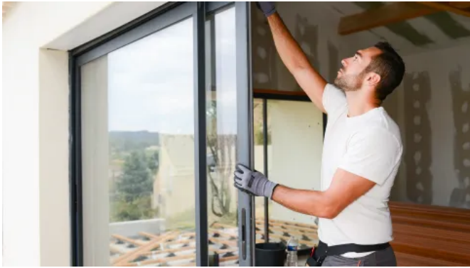
Anwendung EGOPREN C1 FUGENDICHTBAND

Aus der Serie Dichtstoffe von EGO Dichtstoffwerke