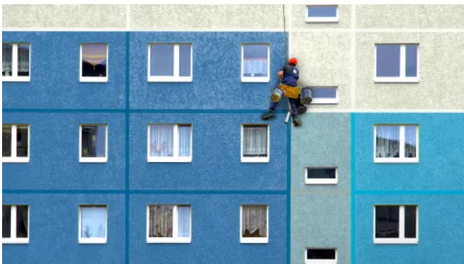
Anwendung EGOSIL TAPE 960