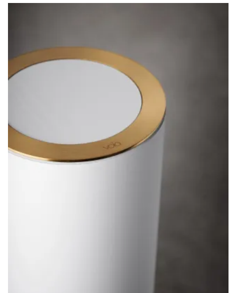
RS11 — Behälter und Deckel weiß