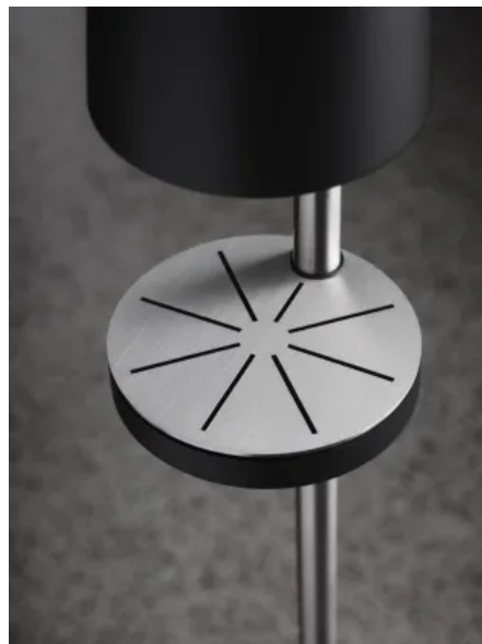
RS11 — Auffangschale