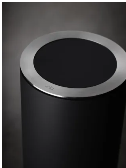
RS11 — Behälter und Deckel schwarz