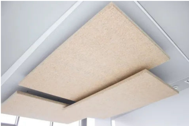
Die Deckensegel Selecta Hemp bestehen aus nachwachsenden Hanffasern.