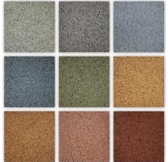
Natura ist in mehreren natürlichen Farbtönen erhältlich.