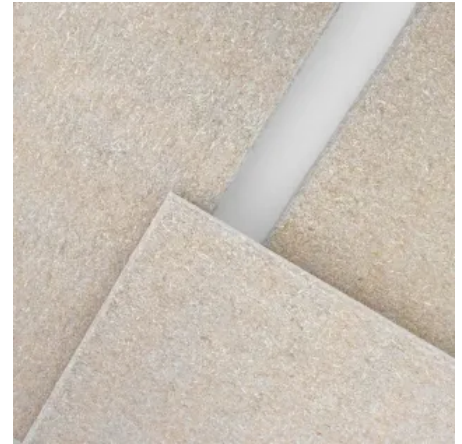
Selecta Hemp in Natur