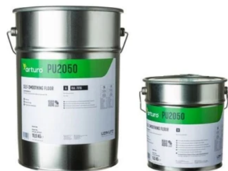
arturo PU2050: UV-stabile, hochelastische PU-Verlaufbeschichtung mit erhöhtem Gehkomfort

Uzin Utz Bodenkompetenz | Systemlösungen Estrich- und Bodenaufbauten