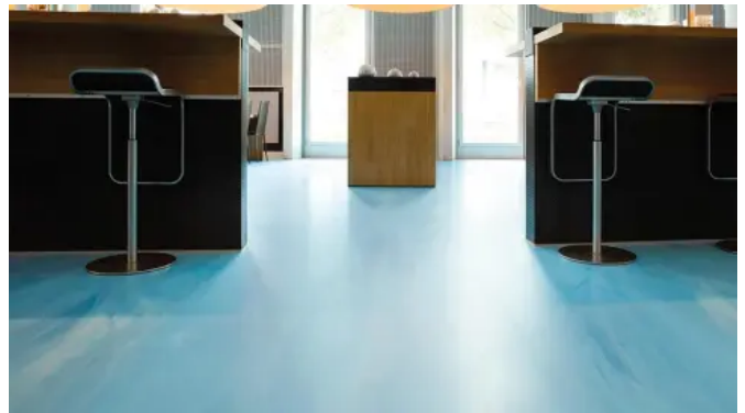
Ein Boden, der die funktionellen Anforderungen an gute Akustik, hohen Laufkomfort und einfache Reinigung erfüllt.