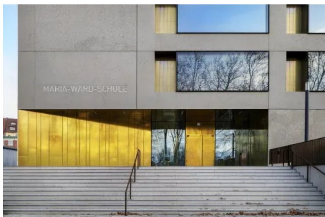
Hochmodernes Schulgebäude: der Neubau der Maria-Ward-Schule in Nürnberg.

Objektbericht zur Referenz Maria-Ward-Schule, Nürnberg