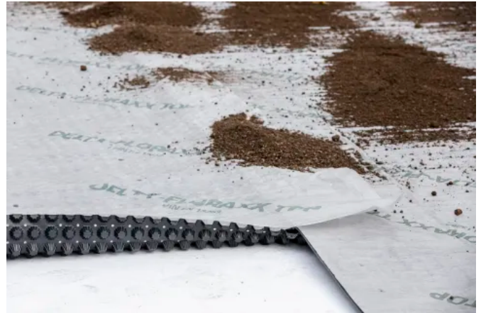
Das aufkaschierte Geotextil verhindert zuverlässig das Zuschlammern der Noppenbahn