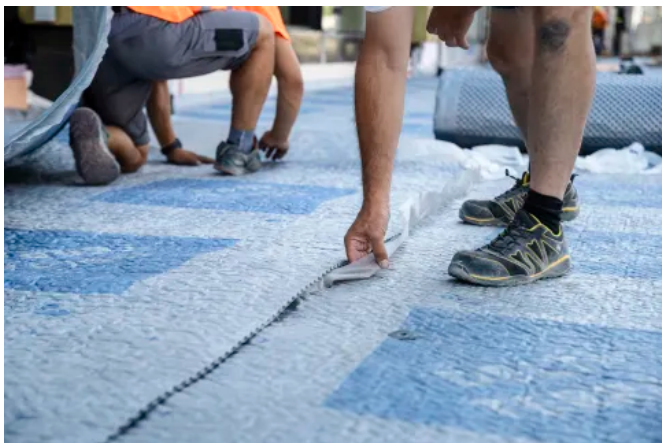
DELTA®-TERRAXX mit integrierten Selbstklebeberand