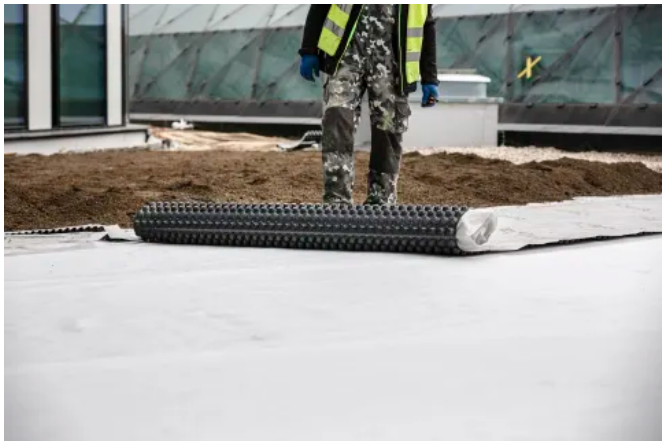
Die Oktagon-Noppe mit Verstärkungsrippen besitzt eine ca. 80 % höhere Druckfestigkeit als Standard-Noppen

Aus der Serie DELTA® Schutz-, Drainage- und Wasserspeicherbahnen von Dörken