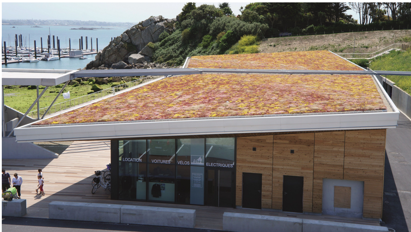
DELTA®-Schutz- und Drainagebahn für genutzte Flachdächer.

Aus der Serie DELTA® Schutz-, Drainage- und Wasserspeicherbahnen von Dörken