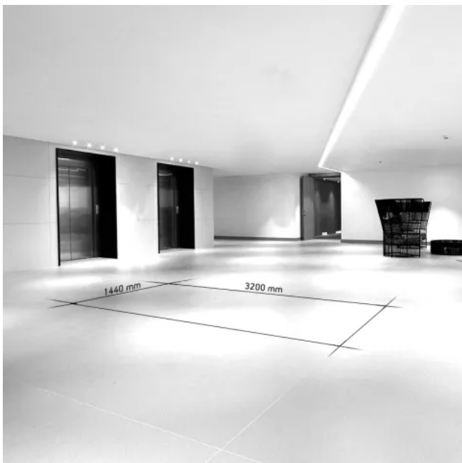
Dekton® großformatige Platten mit vielseitigen Zuschnittsmöglichkeiten