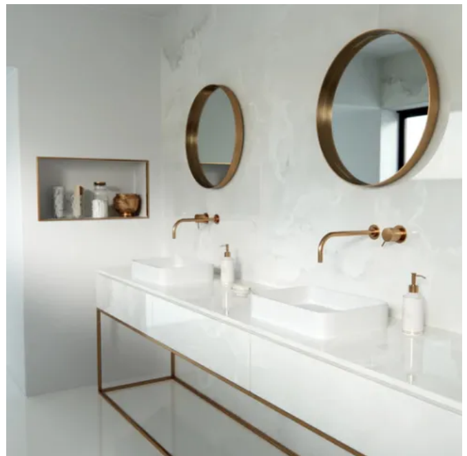
Wandbekleidung und Waschtischplatte im Badezimmer: Dekton®, Helena

Die Haupteigenschaften der Dekton® XGloss Textur sind Glanz und Schärfe, die jede Farbe hyperrealistisch, uniform und intensiv wirken lässt.