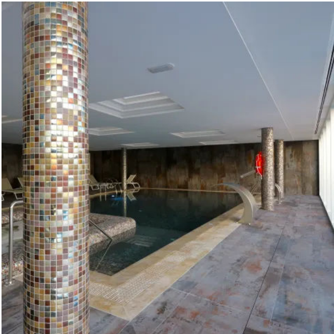
Wandbekleidung und Bodebeläge in Nassbereichen: Dekton® Grip+, Trilium

Dekton® verleiht Treppen und Böden auf unterschiedlichen Höhen Kontinuität in der Raumgestaltung. Das 3D-Design zusammen mit den besonderen mechanischen Eigenschaften und großen Formaten ermöglicht, unbegrenzt ununterbrochene Stufen zu entwerfen, so dass innen als auch außen Treppen und Treppenträume nahtlose und einheitlich wirken.