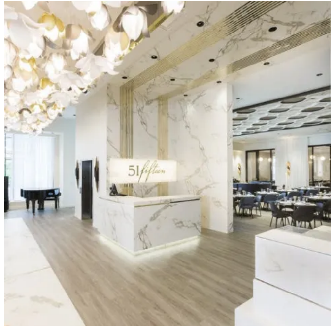
Wandbekleidung, Bodenbeläge und Arbeitsplatten: Dekton®, Aura15

Fugen spielen eine zentrale Rolle für die Qualität und Haltbarkeit bei der Oberflächengestaltung von Bekleidungen. Stabilität der Unterkonstruktion, Umweltbedingungen, Nutzungsanforderungen und Eigenschaften der ausgewählten Verguss- und Versiegelungsmittel nehmen jeweils Einfluss auf Fugen. Als Fugenmaterial empfiehlt Cosentino CG2-Klebstoffe bzw. – Fugenmörtel (gemäß EN-13888) bei Fugenbreiten von 2 mm im Innenbereich, unter Berücksichtigung der Randfugen oder Dehnungsfugen, die erforderlich sind.