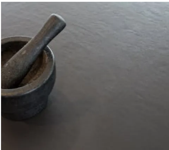
Dekton®, Ultra Textur

Dekton® passt sich den Anforderungen an Oberflächen bei der Gestaltung von Innenbereichen, feuchten Bereichen und Speziallösungen an. Dafür stehen Architekten und Designern eine Auswahl an verschiedenen Texturen zur Verfügung.