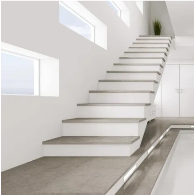
Treppenbeläge: Dekton®, Vegha

Aus der Serie Dekton® - ultrakompakte Oberflächen für Innen- und Außenanwendungen von Cosentino