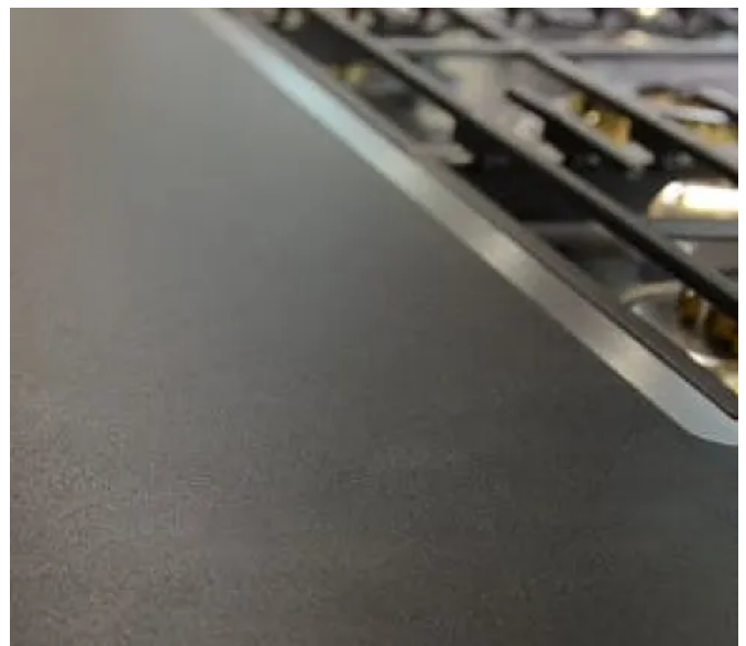
Dekton®, Ultra Matt

Das Ultra Textur-Finish bietet eine haptische Erfahrung der Oberfläche, die auf realistische Art die freie Natur nachbilden.