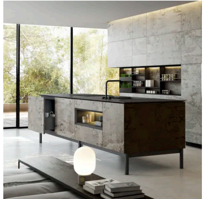
Anwendungsbereich Küche: Dekton® Slim, Trilium

Die neue, großformatige Oberfläche Dekton® Slim mit einer ultradünnen Stärke von 4 mm bietet ebenfalls viele Gestaltungsmöglichkeiten, ist unkompliziert zu transportieren und einfach zu montieren. Das geringe Gewicht und die reduzierte Stärke machen sie zur langlebigen und leistungsfähigen Oberfläche besonders für Bad- und Küchenverkleidungen sowie für alle Arten von Möbelverkleidungen. Wie die anderen Dekton® Oberflächen ist Dekton® Slim kratz- und feuerfest sowie schmutzabweisend. Weitere Informationen: Dekton® Slim