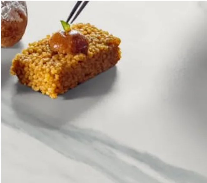
Dekton®, Velvet Textur

Aus der Serie Dekton® - ultrakompakte Oberflächen für Innen- und Außenanwendungen von Cosentino