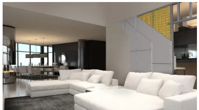
DANO® Montagetreppwände ermöglichen die wirtschaftliche und qualitative Realisierung von Raumkonzepten, auch mit Anforderungen an Schallschutz und Brandschutz.

DANO® Wandsysteme die wirtschaftliche und qualitative Lösung zur Realisierung von Raumkonzepten. Erhöhte Anforderungen an den Schallschutz als auch Brandschutz lassen sich mit Dämmeinlagen, spezieller Beplankung oder Doppelständerwerk erfüllen.