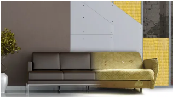
DANO® Vorsatzschalen eignen sich zum Ausgleich von großen Wandunebenheiten und zur Verbesserung des Schall- und Wärmeschutzes bestehender Wände.

Aus der Serie Danogips - Gipsplattensysteme von Danogips