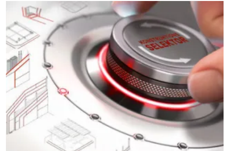
Mit dem Konstruktionsselektor lässt sich die passende DANO®-Konstruktion ermitteln.

Offene Lösungen mit DANO Gipsplatten: Trockenbau kompakt Wand