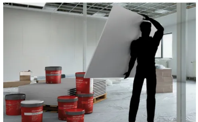
Danogips Gipsplattensysteme: DANO® Gipsplatten und Spachtelmaterial, Profilechnik und Verarbeitungszubehör.

Ausgereifte DANO® Verspachtelungs-Systeme, pulverförmig oder pastös, ermöglichen glatte Wand- und Deckenflächen in Oberflächengüten Q1 bis Q4. DANO® Gipsplattenprodukte und DANO® Spachtelmassen tragen das IBR-Prüfsiegel. Sie sind als schadstoff-, geruchs- und emissionsarm durch unabhängige Prüfinstitute beurteilt und daher ökologisch unbedenklich in ihrer Anwendung.