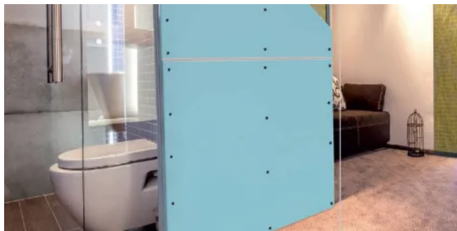
Imprägnierte DANO® Gipsplatten haben sich als wirtschaftliche Beplankung in Feuchträumen etabliert.

DANO® Standard-Gipsplatten sind nicht brennbar (A2-s1,d0), biegsam und faltbar mit V-Fräsung. Sie sind einsetzbar für Wand- und Deckenkonstruktionen, Vorsatzschalen und den Holztafelbau. Für Brandschutzkonstruktionen eignen sich Feuerschutz-Gipsplatten mit einem guten Gefügezusammenhalt unter Brandeinwirkung. Imprägnierte DANO® Gipsplatten stellen eine bewährte Lösung in Feuchträumen dar. Die Platten zeichnen sich durch eine reduzierte Wasseraufnahme sowie ein geringes Quell- und Schwindverhalten aus.