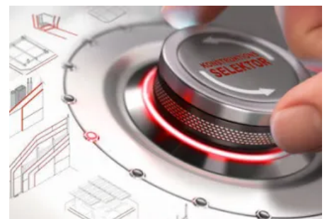
Mit dem Konstruktionsselektor lässt sich die passende DANO®-Konstruktion ermitteln.

Offene Lösungen mit DANO Gipsplatten: Trockenbau kompakt Decke