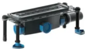
DallFlex 2.0 115