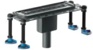
DallFlex 2.0 senkrecht